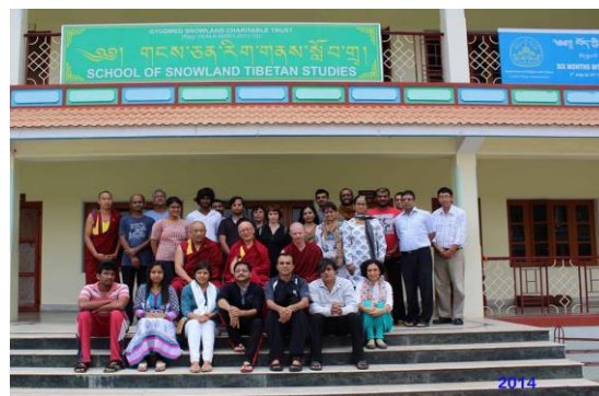
2014 印度人學藏傳靜坐。