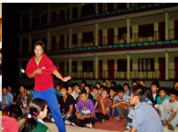
學生們在學習辯經