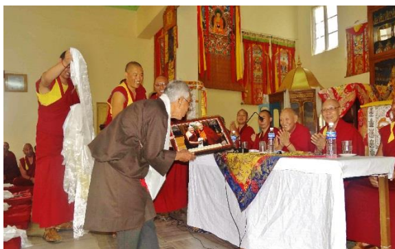
一年一度通過口試的居士們得到達賴喇嘛的法相。