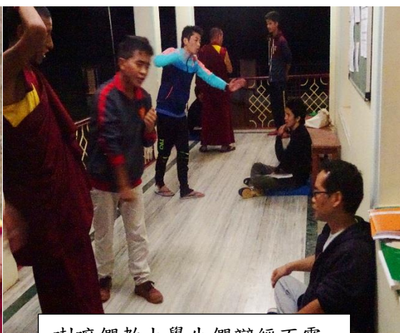
喇嘛們教大學生們辯經不需