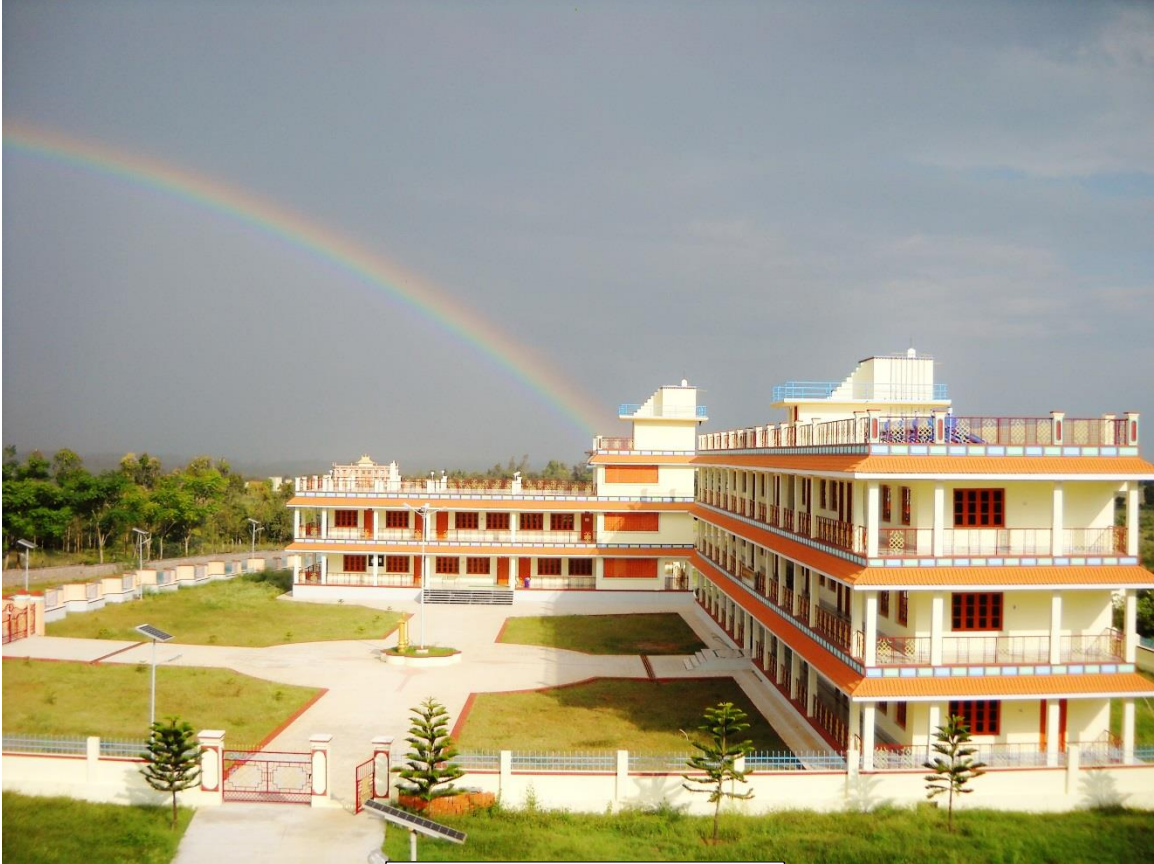
雪域藏傳佛學院從側門拍