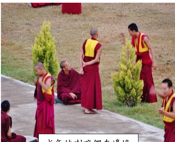
成年的喇嘛們在邊境