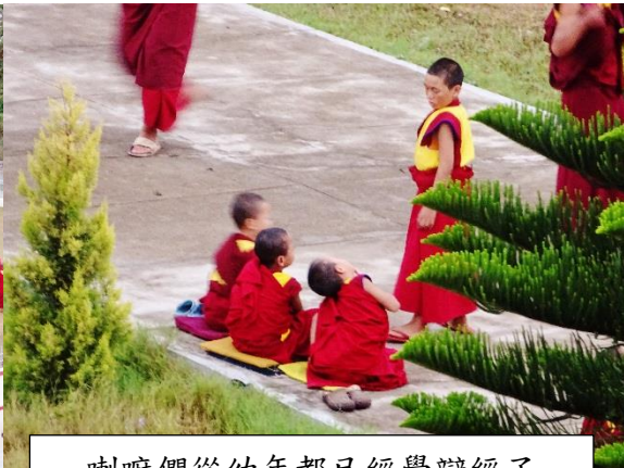
喇嘛們從幼年都已經學辯經了