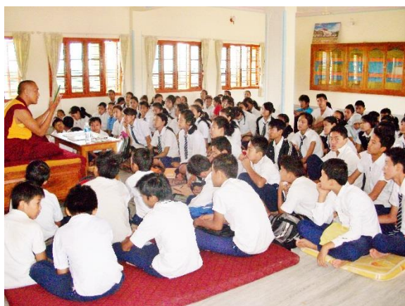
兩百多的藏族學生在聽校長開示

最後我的感想，從他們在很純樸的環境下，能保持永不止息的教育精神，最讓我感動的地方。從這一點讓我學到依佛法為樂的生活。我想當我回印尼時我也要帶給每個人這樣的生活，以佛法為樂的生活。