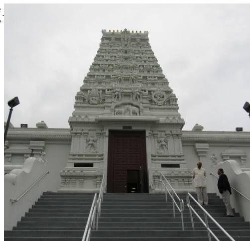
印度教寺院 Sri Siva Vishnu

位於馬里蘭州戈達德的印度教寺廟。這座印度廟是全美最大的印度寺廟，印度教簡單來說就像是台灣的”道教”，他們供奉很多神明。而佛教跟印度有很大的關係，對印度教來說，佛教也是屬於印度教的一部份。