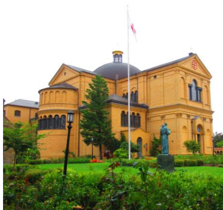
天主教教堂 Franciscan Monastery