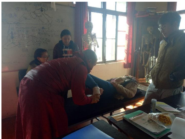
▲推拿課堂上同學們互相練習。

因為我們在課程上探討的文獻就是藏醫院學生花費五年學習的教科書「醫學四續」，因此有基礎的藏醫知識。但在跟診時我們遇到了一個重大的困難—「語言」，因為當地無論是藏人亦或印度人，都說藏語或是印度話，英文則是必備的外語能力，因此我們需要醫生翻譯成中文或英文才能知道他們與病患之間的談話內容。幸運的是，我們遇到一位想練習中文的醫生，在沒有病人時，醫生用中文教導我們藏醫的知識，這是整個實習中最大的收穫—「既能幫助到醫生精進中文能力，我們又能學習新知」。他在幾年前曾到過台灣學習針灸，是藏醫院中唯二使用針灸的醫生，因為現今在印度藏醫院的正式教學系統中只教了把脈，尿診在藏醫院系統中並不使用，其他的外治手法也要靠別國的志願教師來教導。