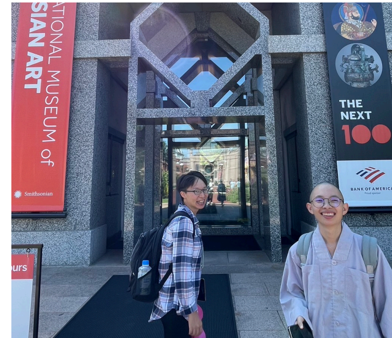
NATIONAL MUSEUM OF ASIAN ART

參加斯里蘭卡佛教長老——Gunaratana 的祝壽活動，並了解斯里蘭卡及其佛教歷史