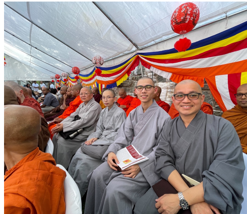
EMBASSY OF SRI LANKA

參加斯里蘭卡佛教長老——Gunaratana 的祝壽活動，並了解斯里蘭卡及其佛教歷史