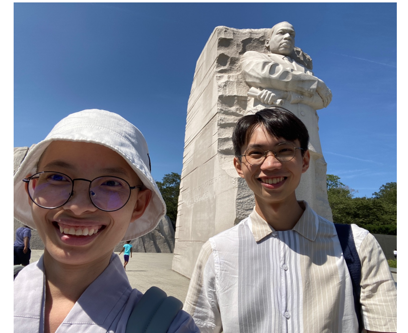
MARTIN LUTHER KING, JR. NATIONAL HISTORICAL PARK

參訪國家歷史公園——馬丁路德金恩博士出生的住所，了解其歷史意義及博士在種族平權上的貢獻