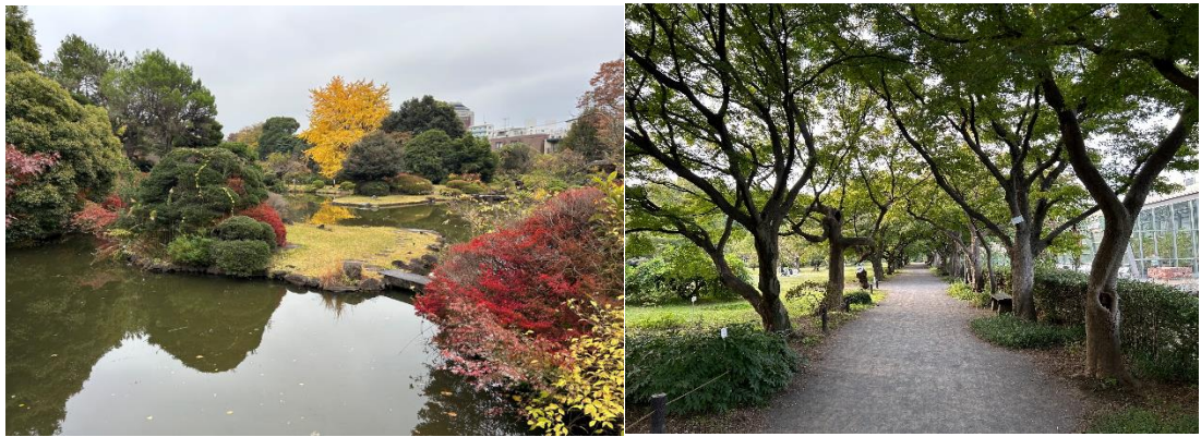
小石川植物園的池塘和林木