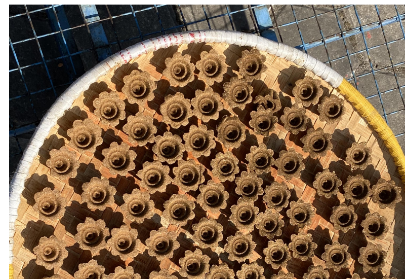
圖片4&5：藏醫學校製作藏藥與藏香（筆者本人拍攝）