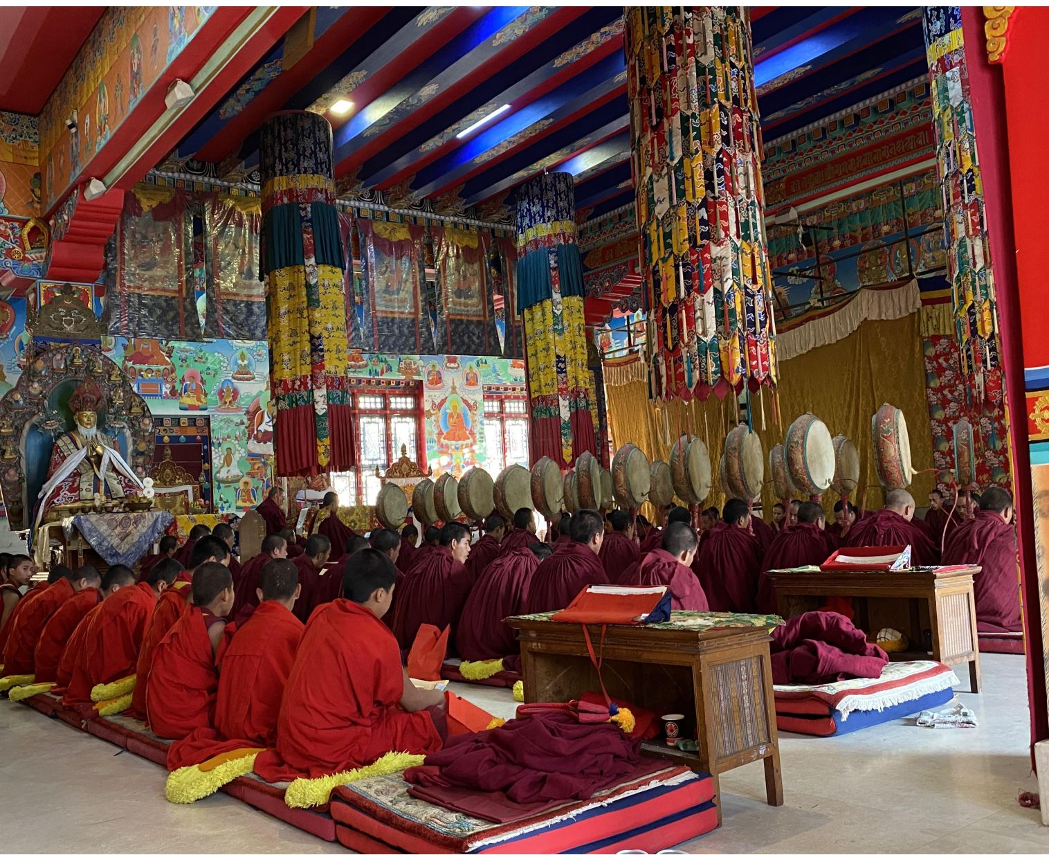
圖片3：雪謙寺的法會