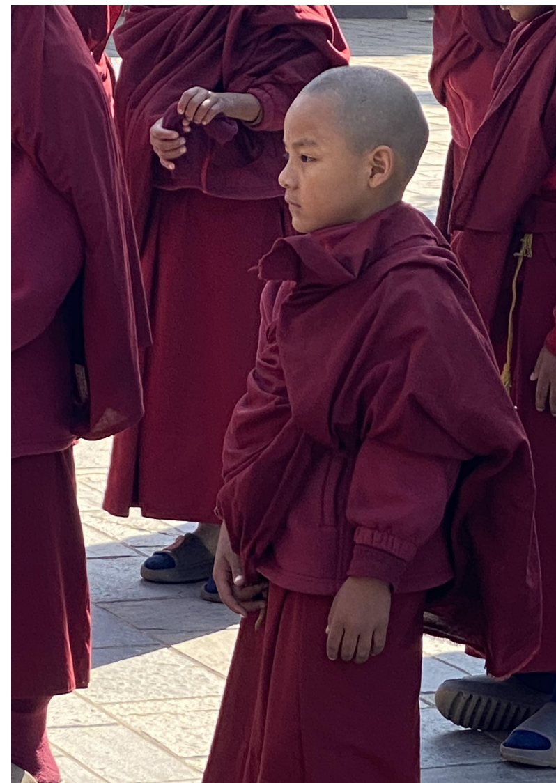
圖片2：由筆者本人在尼泊爾塔蘭寺拍攝

西藏醫學與我們常接觸的西醫、中醫不同，它強調的是身心靈全方位的療癒，因此老師為我們安排的課程也是全方位的：我們有藏醫親自引導的Yuthok禪修課，有藏藥、藏香的實習製作，到診所看藏醫如何問診，親自體驗溫灸、SPA及看診經驗。藏醫會關心我們的飲食、睡眠、身體的保暖、煩惱的起源.....，種種關於我們身體疾病的遠因近因，開立的藏藥也十分溫和有效。老師也帶我們參加祈福法會，到寺院設立的學校拜訪校長、堪布，對他們進行訪談，了解藏醫在傳統僧伽教育中的角色，以及當代的僧伽教育如何與傳統佛教教育達到一種平衡，我們也感受到僧伽教育在品德的培養上著力甚深，對孩子的成長有正向的影響及助益。